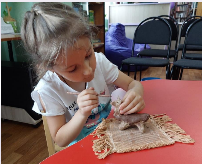
«Лепка из глины»